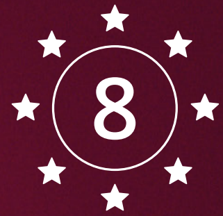
Table VIP* 8 personnes